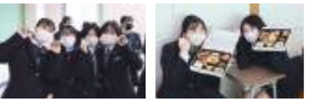
▲1月12日、各学科の受験生へ激励の品が配られた。 ▲1月13日に専門課程2年生へ配られたのは「合格祈願弁当」。応援の気持ちが入っている。

寒さも厳しい1、2月。学校生活の集大成とも呼べる各種試験が続々と行われた。普通科3年生は大学入学共通テスト、総合福祉科3年生は介護福祉士国家試験、看護学科専門課程2年生は看護師国家試験と、それぞれが最大目標として励んできた試験である。試験前に行われた各出発式では、教職員や後輩から激励のメッセージが送られ、受験生の背中を押した。毎日続けてきた努力が実り、それぞれが進路実現を達成することが期待される。