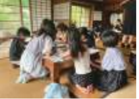
▲鹿児島県共生・協働型地域コミュニティづくり推進優良団体の学校部門で奨励賞を受賞した。

月1回の居場所の開放を目標に、集まった子どもたちが楽しく過ごせるよう工作やゲームなどの企画も考えながら協力して活動を進めている。