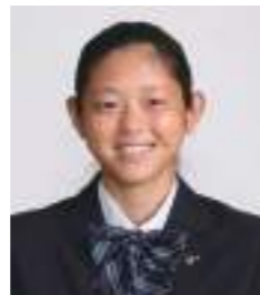
行部 心彩 普通科特進コースII類