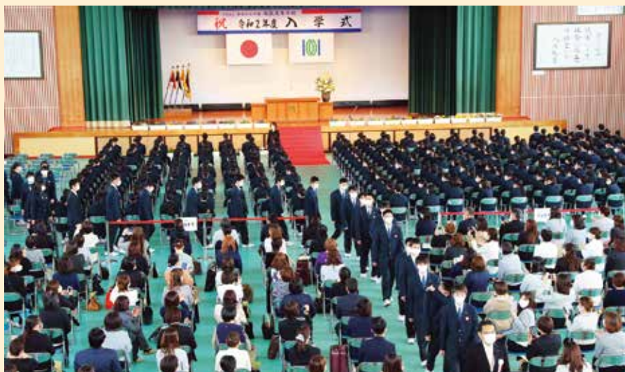
▲ 入学生と保護者のみの参加となった入学式（4月9日本校体育館）

令和2年度が幕を開け、新たな出会いへの期待と、やわらかな春風に包まれた4月9日。第56回鳳凰高等学校・第15回看護学科専門課程の入学式が本校体育館（専門課程は武道館）で行われた。全国各地より集った1年生399名、看護学科専門課程1年生205名、合計604名が新たに鳳凰高校の一翼となり、高校生・専門課程生としての第一歩を踏み出した。