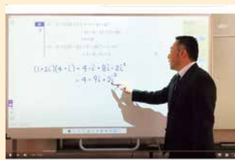
▲ YouTube 解説動画