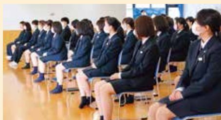
▲ 看護学科専門課程入学式（4月9日本校武道館）

令和2年度が幕を開け、新たな出会いへの期待と、やわらかな春風に包まれた4月9日。第56回鳳凰高等学校・第15回看護学科専門課程の入学式が本校体育館（専門課程は武道館）で行われた。全国各地より集った1年生399名、看護学科専門課程1年生205名、合計604名が新たに鳳凰高校の一翼となり、高校生・専門課程生としての第一歩を踏み出した。