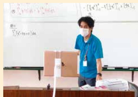
▲ Zoom を使ったオンライン授業の様子