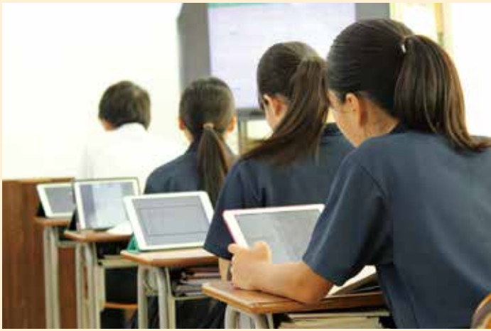
▲ タブレットを用いて学習する生徒