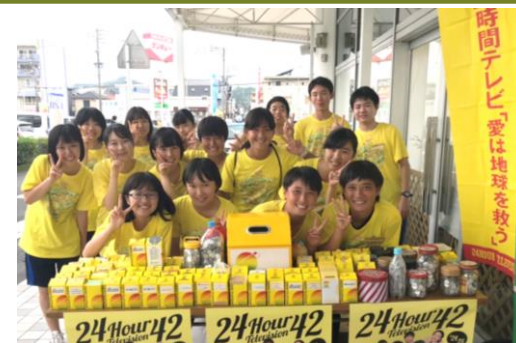
▲(サンキュー和田店にて)