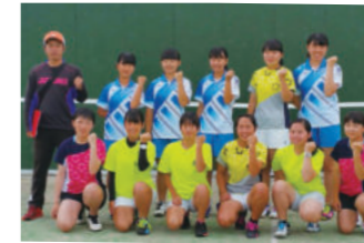
女子ソフトテニス部