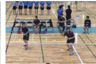
バドミントン部女子